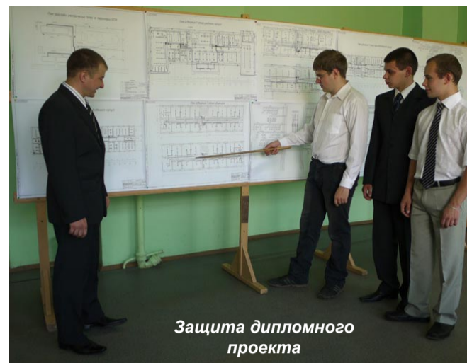
Защита дипломного проекта

Расширение образовательного пространства предполагает рост мобильности и сотрудничества преподавателей и студентов, взаимодействия с сообществом, интеграцию обучения и воспитания. Намечается положительная динамика интересов к дополнительному образованию, спорту. Колледж значительно расширил круг предложений в досуговой деятельности, полностью загружен спортзал, включаются в работу тренажёрный зал, стрелковый тир. Наиболее подготовленные студенты примут участие в проектной деятельности, всероссийских конкурсах, в том числе и грантовых. С учётом предложений бежечан, ещё не потерявших надежды на со-