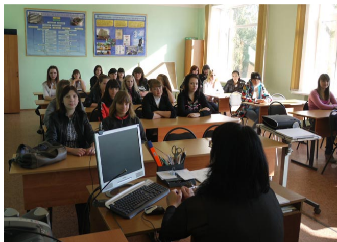
Занятия в аудитории колледжа