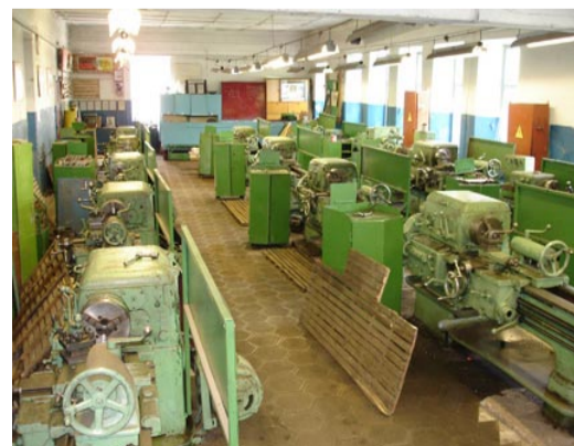
В учебно-производственных мастерских

целью изменяется структура государственного управления колледжем. Она должна стать реальной, работающей, основной прежде всего на взаимодействии долж-