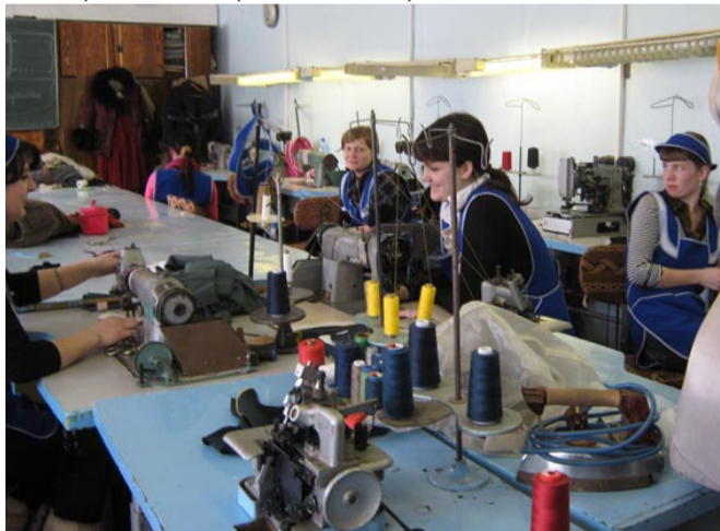
Здесь готовят будущих швей

Начало нового пути потребовало определенных изменений в структуре, содержании работы, поиске новых подходов и направлений. Главное стратегическое направление – повышение качества образования, поскольку именно оно определяет сегодня качество экономики и качество жизни общества в целом. С этой