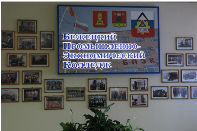
Фойе учебного корпуса

ностных лиц, специалистов сопровождения образовательного процесса и коллектива в целом. Идёт поиск модели управления качеством образования – только выверенный управляемый процесс может привести к выпуску востребованных специалистов, готовых без