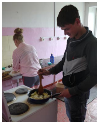
Ужин - дело тонкое